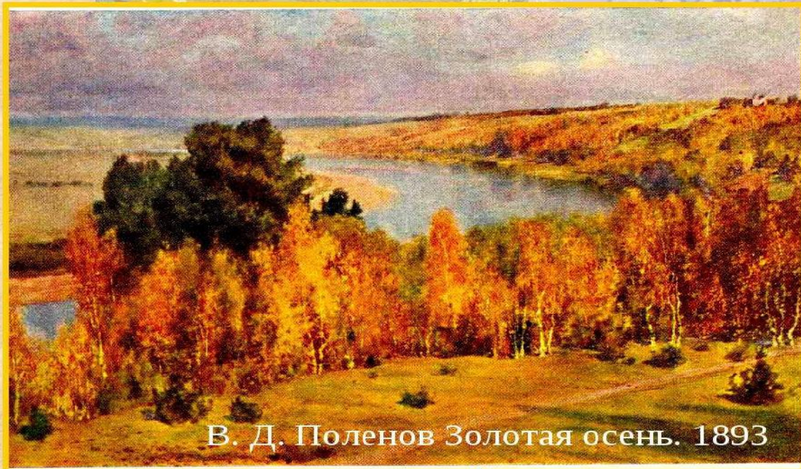
В. Д. Поленов Золотая осень. 1893