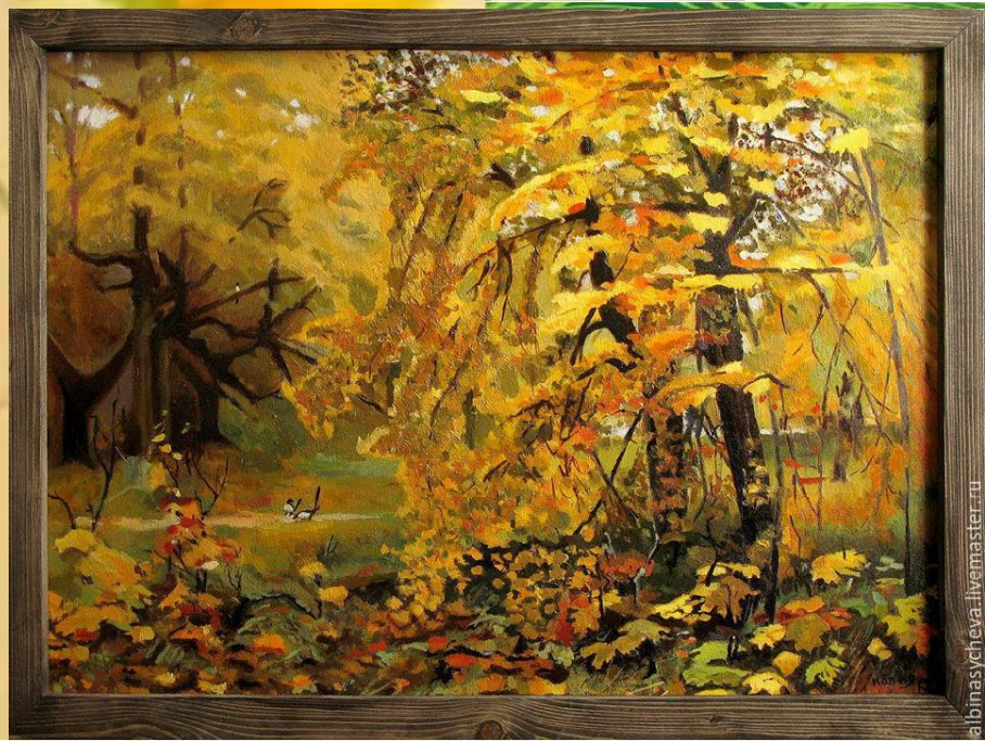
И.И. ЛЕВИТАН «ЗОЛОТАЯ ОСЕНЬ»